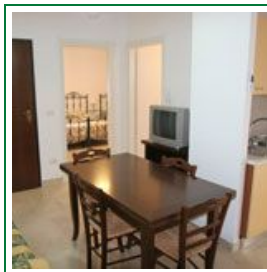
Affittasi appartamenti indipendenti a Torre Lapillo - Porto Cesareo